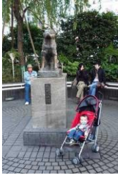
Bức tượng đài chú chó Hachiko

Cứ mỗi buổi sáng hằng ngày, Hachiko lại đi bộ với giáo sư Ueno Eizaburo đến Nhà Ga để tiễn ông lên tàu đi làm. Và cứ đến 3 giờ chiều, Hachiko lại ra Nhà Ga đợi ông về.