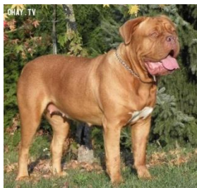
Dogue de Bordeaux

- Dogue de Bordeaux (Chó Ngao Pháp): Cân nặng trên 68kg và chiều cao khoảng 70cm. Những chú chó này đã từng suýt bị tuyệt chủng do nạn săn bắt vào đầu thế kỷ XX và phải nhờ sự nỗ lực của chính quyền, người dân thì giống chó này mới được bảo tồn đến ngày nay.